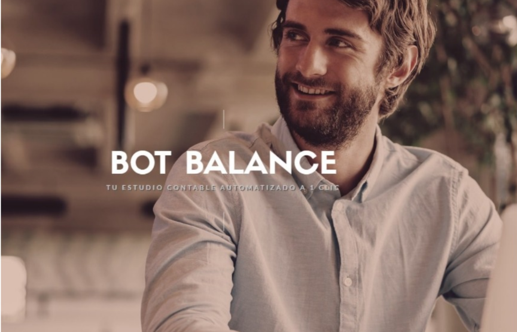
PATROCINADO BOT BALANCE